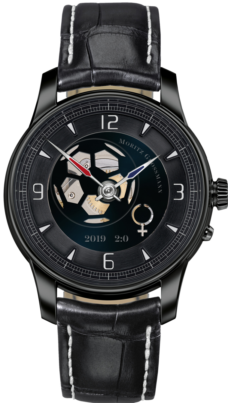
Women's World Cup SOCCER WATCH